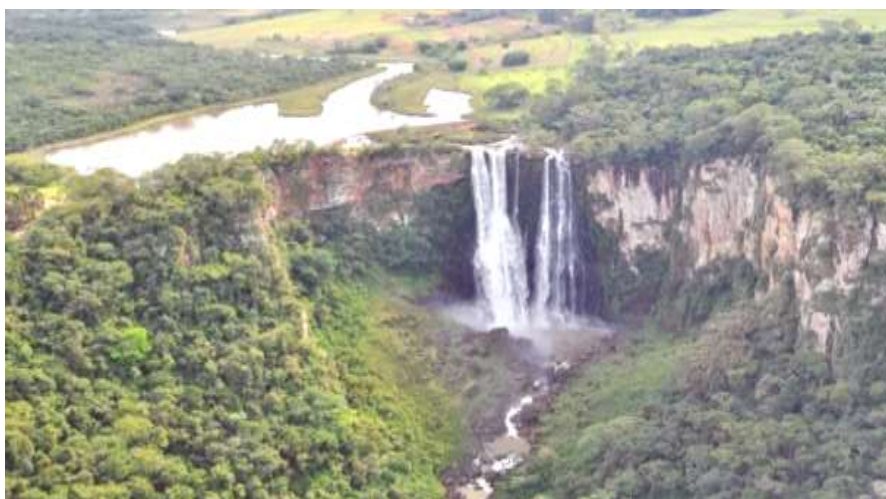
SALTO DO APUCARANINHA, COM 116 METROS DE ALTURA.

NA CIDADE DE LONDRINA EXISTE UMA RESERVA INDÍGENA DA ETNIA KAINGANGS, CHAMADA RESERVA DO APUCARANINHA. ELA TEM ESSE NOME POR CAUSA DO RIO APUCARANINHA QUE PASSA PELAS TERRAS DA RESERVA.